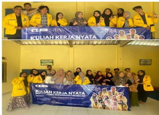
Gambar .Kegiatan pelatihan toto wajah

Dalam pengembangan UMKM. Pembuatan asesoris juga merupakan hal yang sangat mendukung pemasukan bagi para ibu – ibu rumah tangga yang bs dikerjakan dirumah dan tetap mendapat penghasilan. Dengan menggunakan keterampilan tangan dan pembelajaran pembuatan asesoris gelang, cincin, dan rantai untuk perempuan. Anak perempuan dan wanita idientik dengan keindahan penggunaan gelang, rantai dan cincin merupakan simbol kecantikan bagi seorang perempuan maka dari itu para pengabdian melakukan pengabdian dengan menggunakan manik- manik untuk pembuatan gelang, cincin, dan rantai. Dengan adanya kegiatan ini