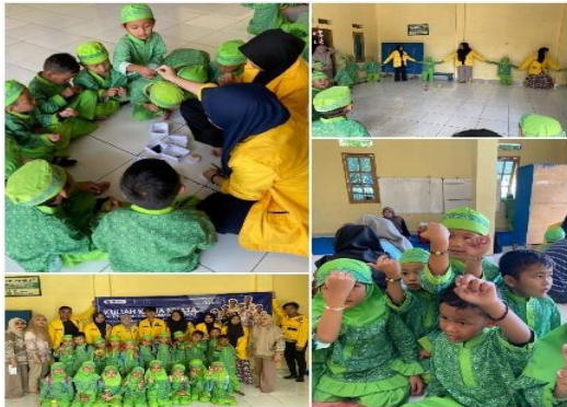
Gambar . Pembuatan manik - manik

fresh dan segar. Dengan adanya pelatihan totok wajah maka akan menambah pengetahuan dan keterampilan masyarakat dalam memajukan UMKM. Di desa kalibaru.