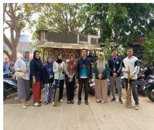
Gambar. Kegiatan kebersihan

Didalam kegiatan pengabdian para pengabdian juga melakukan kegiatan keagamaan pesantren kilat. Dimana didalam pesantren kilat para siswa – siswi