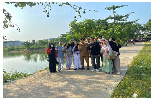
Gambar. Desa kalibaru

Para pengabdian sangat senang dapat memberikan wawasan mengenai pembuatan asesoris dari manik – manik.