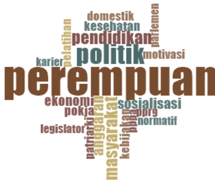
Gambar 1. Word Cloud