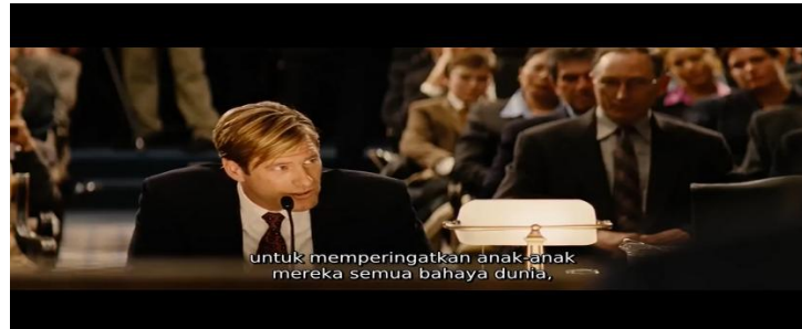
Gambar 5. Nick Naylor di sidang senat sebagai perwakilan perusahaan.

hanya menaturalisasi cara kerja PR sebagai profesi, melainkan menaturalisasi sebuah ideologi yang jauh lebih besar tentang hubungan antara korporasi, individu, dan negara. Ketika Nick menyampaikan argumen pengalihan tanggung jawab di hadapan sidang senat dengan cara yang tampak logis dan tidak dapat dengan mudah dibantah dalam kerangka debat formal, film sedang menaturalisasi premis bahwa kebebasan individu adalah nilai yang lebih tinggi dari perlindungan kolektif sebuah ideologi yang secara historis telah menjadi salah satu argumen paling efektif yang digunakan industri-industri kontroversial untuk menghindari regulasi.