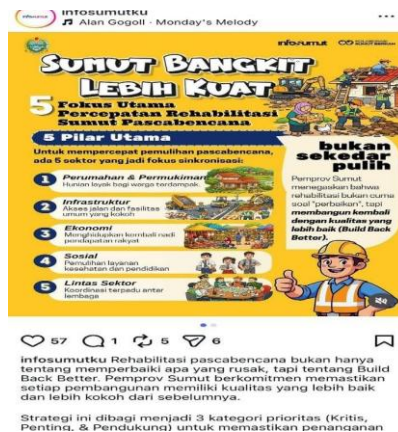
Gambar 2. Konten Instagram @infosumutku mengenai program rehabilitasi pascabencana “Sumut Bangkit Lebih Kuat”.

Berdasarkan hasil observasi mendalam terhadap akun Instagram @infosumutku, ditemukan bahwa pola konten yang disajikan dapat diklasifikasikan ke dalam beberapa kategori utama, yaitu konten informatif, edukatif, dokumentatif, dan klarifikatif. Konten informatif berfokus pada penyampaian kebijakan dan program pemerintah, konten edukatif berisi himbauan sosial, konten dokumentatif menampilkan aktivitas pemerintah, sedangkan konten klarifikatif digunakan untuk merespons isu negatif. Klasifikasi ini menunjukkan bahwa humas telah menjalankan fungsi komunikasi publik secara cukup komprehensif, sekaligus berupaya mengelola persepsi publik melalui variasi pendekatan pesan.