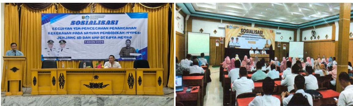
Gambar 1. Kegiatan Sosialisasi

Implementasi kebijakan anti-bullying di Sekolah Dasar Kota Metro telah dilaksanakan melalui mekanisme kelembagaan yang terstruktur dan sistematis, baik di tingkat Dinas Pendidikan maupun satuan pendidikan. Secara kelembagaan, Dinas Pendidikan mendorong pembentukan Tim Pencegahan dan Penanganan Kekerasan (TPPK) di setiap sekolah sebagai ujung tombak pelaksanaan kebijakan. Proses ini diawali dengan rapat persiapan kegiatan pencegahan dan penanganan kekerasan pada jenjang SD yang dilaksanakan pada Kamis, 1 Agustus 2024. Dari rapat tersebut dihasilkan beberapa langkah strategis, yaitu: pertama, penyusunan Surat Keputusan (SK) sebagai dasar pembentukan tim pencegahan dan penanganan kekerasan di satuan pendidikan; kedua, pelaksanaan sosialisasi terkait pembentukan dan peran tim tersebut; ketiga, sosialisasi difokuskan kepada kepala sekolah dan komite sebagai perwakilan utama di tingkat sekolah; dan keempat, setelah sosialisasi dilakukan, kegiatan dilanjutkan dengan monitoring dan evaluasi yang dijadwalkan secara berkala sesuai kebutuhan dan perkembangan di lapangan. Alur ini menunjukkan bahwa implementasi kebijakan dilakukan secara bertahap, dimulai dari perencanaan, pembentukan kelembagaan, sosialisasi, hingga evaluasi berkelanjutan. kegiatan sosialisasi yang sangat masif yang dihadiri seluruh pihak.