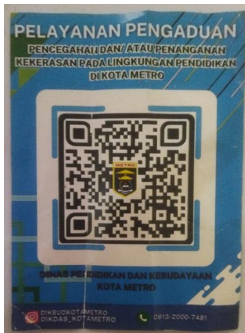
Gambar 2. Scan Barcode Pelayanan Pengaduan