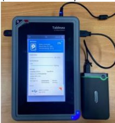
Gambar 1.2 Tableau Imager (Alat khusus untuk proses imaging harddisk dan flashdisk )

Dalam hal ini, CCTV berperan sebagai salah satu sumber bukti yang sangat penting dalam penyelidikan tindak kriminal. Data yang direkam oleh CCTV dapat menjadi saksi mata yang memberikan gambaran jelas tentang bagaimana suatu tindak kriminal terjadi, siapa saja yang terlibat, serta modus operandi pelaku. Penyelidikan forensik digital melalui CCTV tidak hanya melibatkan proses teknis dalam mengekstraksi dan menganalisis rekaman video, tetapi juga membutuhkan pemahaman yang mendalam tentang perilaku kriminal yang bisa dianalisis melalui kriminologi forensik. Kriminologi forensik menggabungkan teori-teori kejahatan dengan teknik-teknik forensik untuk menggali informasi lebih jauh mengenai faktor-faktor yang mempengaruhi tindakan kriminal dan bagaimana bukti yang ditemukan dapat mengungkap motif serta karakteristik pelaku. Sebagaimana penjelasan dari para ahli, Forensik digital adalah partisipasi ilmu komputer dan teknologi digital dalam prosedur investigasi untuk mengumpulkan bukti digital suatu kejahatan. Dengan menggunakan alat khusus dan persamaan matematika, setara dengan bukti fisik deteksi kejahatan, dan disajikan dalam bentuk laporan yang dapat digunakan sebagai bukti di pengadilan.