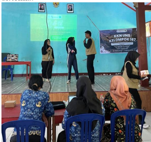
Gambar 4. Penyampaian materi Gerbang Cakrawala

proses kegiatan sehingga materi lebih mudah dipahami dan diterima.