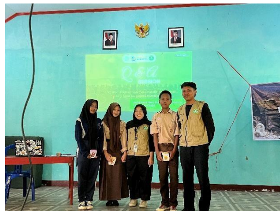
Gambar 1. Pelaksanaan kegiatan Gerbang Cakrawala

Kegiatan Gerbang Cakrawala dilaksanakan di SMP Negeri 3 Sukoharjo, Desa Pucungwetan, Kabupaten Wonosobo, sebagai bentuk sosialisasi mengenai pentingnya pendidikan formal serta pengembangan hard skill dan soft skill bagi siswa remaja. Kegiatan berlangsung dengan metode presentasi interaktif, sesi tanya jawab, motivational storytelling , dan diskusi bersama yang dirancang untuk membangun motivasi siswa terhadap pendidikan dan masa depan mereka.