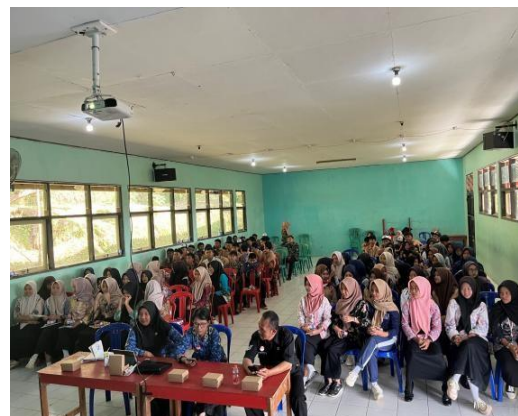
Gambar 2. Peserta program Gerbang Cakrawala

Kegiatan sosialisasi berlangsung secara kondusif dan interaktif. Siswa terlihat fokus dalam memperhatikan materi yang disampaikan terkait pentingnya pendidikan formal sebagai bekal masa depan. Selain itu, penyampaian materi mengenai hard skill dan soft skill juga mampu menarik perhatian siswa karena dikaitkan dengan kehidupan sehari-hari dan dunia kerja. Pendekatan interaktif yang digunakan membuat siswa lebih mudah memahami materi serta membangun suasana pembelajaran yang aktif.