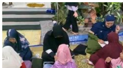
Gambar 2. Kegiatan Santri Membaca Iqra' dan Al-Qur'an di TPQ

Kegiatan membaca iqra' dan Al-Qur'an juga menjadi bagian utama dalam proses pembelajaran di TPQ. Pengamatan menunjukkan bahwa santri membaca secara bergiliran dengan didampingi pengajar yang menyimak dan memperbaiki bacaan. Pola tersebut menunjukkan adanya pembiasaan belajar yang rutin serta hubungan langsung antara santri dan pengajar.