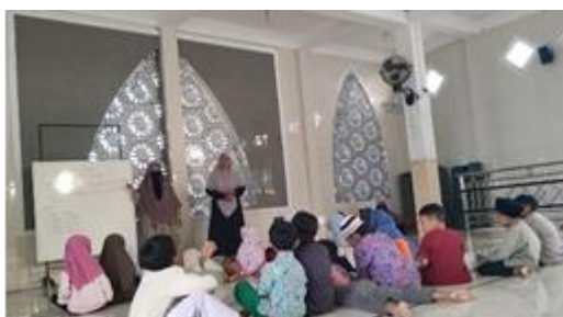
Gambar 1. Penyampaian Materi Keagamaan

Hasil wawancara dengan pengajar TPQ menunjukkan bahwa proses pembelajaran dilakukan melalui perpaduan metode ceramah dan dialog interaktif. Pengajar menjelaskan bahwa penyampaian materi sering disesuaikan dengan kondisi santri agar pembelajaran lebih mudah diterima. Pengamatan selama KKN menunjukkan bahwa setelah kegiatan membaca iqra' atau Al-Qur'an, santri dibagi ke dalam kelompok sesuai usia dan kemampuan untuk mengikuti penyampaian materi keagamaan.