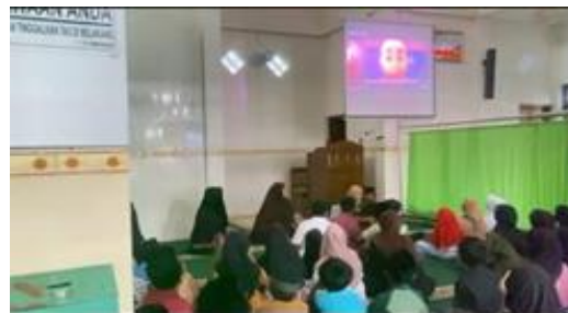
Gambar 3. Kegiatan Pembelajaran Menggunakan LCD

Takmir juga menjelaskan bahwa materi dan kegiatan pendidikan disusun sesuai kebutuhan lingkungan sekitar. Sistem pendidikan diupayakan tetap dinamis mengikuti perkembangan zaman. Fasilitas pendukung seperti LCD telah tersedia di masjid, meskipun selama pengamatan belum dimanfaatkan secara rutin oleh pengajar TPQ dalam kegiatan pembelajaran. Pengamatan selama KKN menunjukkan bahwa fasilitas tersebut dapat digunakan sebagai media pendukung melalui pemutaran film Islami dan kuis interaktif.