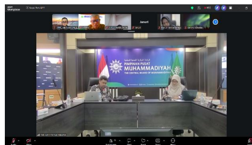
Gambar 1 Tampilan Ketua dan Sekretaris LPPK PP Muhammadiyah

Sebagai bagian dari kegiatan, dokumentasi kegiatan turut disajikan. Berikut bukti screenshot kegiatan (online melalui zoom meeting):