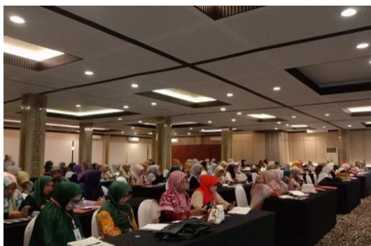
Gambar 1. Para Kepala Sekolah

professional untuk penerapan kurikulum Merdeka. Kepala sekolah dituntut lebih baik lagi memimbing, mengarahkan, dan menginspirasi Lembaga sekolah untuk sekolah yang lebih maju dan memiliki mutu, terakreditasi di Badan Akreditasi Nasional.