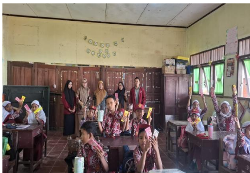
Gambar 5. Evaluasi