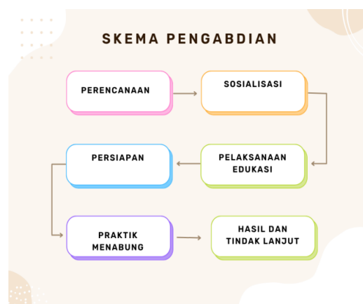
Gambar 1. Skema Pengabdian

menabung”, permainan interaktif, serta kuis edukatif yang mendorong keterlibatan siswa secara langsung. Hal ini terlihat dari antusiasme siswa dalam memperhatikan materi, menjawab pertanyaan, serta berpartisipasi dalam diskusi mengenai pengalaman mereka dalam mengelola uang saku.