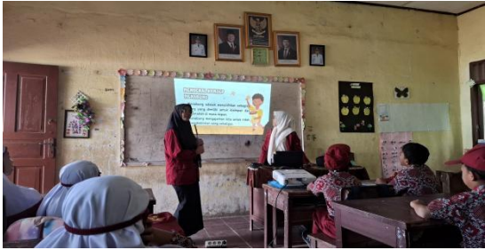
Gambar 3. Edukasi