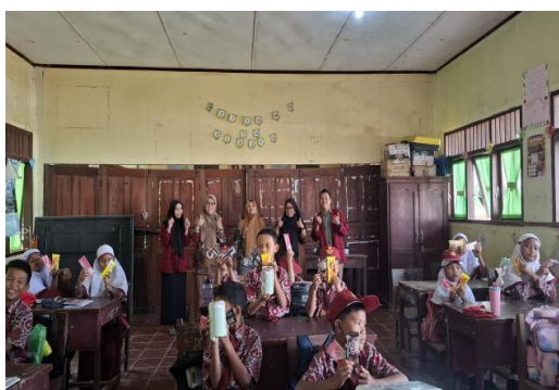
Gambar 6. Evaluasi

Gambar di atas menunjukkan kegiatan yang berlangsung di dalam kelas dengan suasana aktif dan menyenangkan, di mana para siswa terlihat antusias mengikuti kuis dan permainan edukatif sambil memegang media pembelajaran maupun hadiah sederhana, sementara tim pengabdian mendampingi dan mengarahkan kegiatan. Melalui pendekatan interaktif ini, siswa dikenalkan pada konsep dasar pengelolaan keuangan seperti menabung, membedakan kebutuhan dan keinginan, serta pengambilan keputusan sederhana, sehingga kegiatan ini efektif dalam meningkatkan literasi keuangan anak sekaligus menciptakan pengalaman belajar yang partisipatif dan bermakna. Perlunya integrasi sistematis literasi keuangan ke dalam kurikulum pendidikan dasar ditekankan, sebagaimana dibuktikan dengan peningkatan signifikan dalam pemahaman siswa (Zebua et al., 2025).