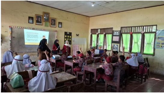
Gambar 2. Sosialisasi