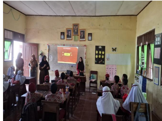
Gambar 4. Kuis

Terlihat suasana pembelajaran di dalam kelas dengan siswa-siswi yang duduk rapi dan fokus mengikuti kegiatan, sementara fasilitator atau tim pengabdian berada di bagian depan kelas memberikan arahan. Kegiatan ini dirancang secara terstruktur dengan memanfaatkan media visual, permainan, serta kuis interaktif sebagai sarana penyampaian materi, sehingga mampu menciptakan suasana belajar yang lebih menarik dan tidak monoton.