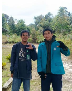
Gambar 5 Wawancara Penjaga Wisata

Berdasarkan informasi yang diperoleh melalui wawancara dengan penjaga situs wisata danau Sicike-cike dan petuah adat, bahwa wisata alam tersebut memiliki sebuah cerita yang menarik.