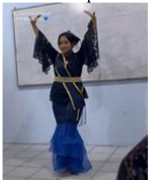
Gambar 2. Pagelaran Tari Tatak Marjuma

menggambarkan kehidupan masyarakat yang erat kaitannya dengan kegiatan bercocok tanam di ladang. Gerakan-gerakan dalam Tatak Marjuma meniru aktivitas para petani, seperti membuka ladang, menanam, merawat tanaman, hingga memanen hasil pertanian.