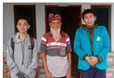
Gambar 6. Wawancara Petuah Adat

Danau Sicike Cike merupakan danau yang memiliki luas sekitar 4 hektar. Danau Sicike cike merupakan taman wisata alam yang termasuk kawasan konservasi Provinsi Sumatera Utara. Danau ini berada di Desa Lae Hole, Kecamatan Parbuluan. Jarak danau dengan pusat kota Kabupaten Dairi sekitar 20 km dengan waktu tempuh 30-40 menit. Berada pada kisaran ketinggian 1.350 1.500 m dpl, danau ini menyimpan berbagai keindahan alam.