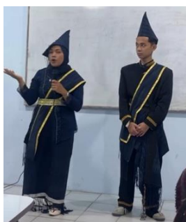
Gambar 4. Baju adat

h) Hiasan atau aksesoris seperti kalung atau ornamen logam yang menunjukkan status sosial, keberanian, dan kebanggaan terhadap budaya Pakpak.