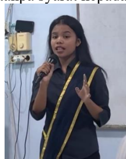
Gambar 3. Penjelasan Page Pullut

Beberapa hari kemudian, seluruh warga Sicike-cike berkumpul. Para tetua adat berdiri di hadapan Page Pulut. Dalam tradisi Pakpak, penghargaan tertinggi yang bisa diberikan kepada seseorang bukan emas atau jabatan, melainkan pengakuan komunitas di hadapan seluruh warga desa. Sejak hari itu, nama Page Pulut bukan lagi sekadar nama seseorang. Ia menjadi simbol keberanian tanpa ego, kepemimpinan tanpa takhta, dan cinta tanpa syarat kepada sesama.