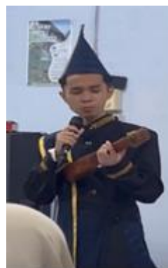
Gambar 1. Alat musik husapi

dengan badan yang memanjang dan biasanya terbuat dari kayu. Instrumen ini menghasilkan bunyi yang lembut dan khas, sehingga sering digunakan untuk mengiringi nyanyian tradisional, upacara adat, maupun pertunjukan seni masyarakat Pakpak. Dalam kehidupan masyarakat, husapi tidak hanya berfungsi sebagai alat hiburan, tetapi juga memiliki nilai budaya karena sering dimainkan dalam berbagai kegiatan adat dan acara kebudayaan.