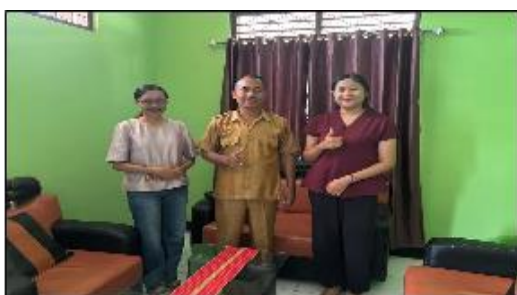
Gambar 2. Diskusi awal dengan kepala desa tanah merah.

Pada tahap ini, berdasarkan hasil koordinasi dengan kepala desa, disepakati bahwa kegiatan PkM dilaksanakan pada hari Jumat, 21 November 2025, bertempat di aula kantor desa, dengan jumlah peserta 50 orang.