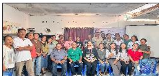
Gambar 4. Evaluasi

Evaluasi kegiatan dilakukan melalui diskusi dan tanya jawab bersama peserta dan perangkat desa. Berdasarkan hasil evaluasi, kegiatan pelatihan memberikan dampak yang positif terhadap peningkatan pengetahuan dan keterampilan peserta dalam pengelolaan keuangan kelompok tani. Peserta menyatakan bahwa materi yang disampaikan mudah dipahami dan relevan dengan dengan kebutuhan kelompok tani.