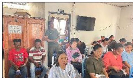
Gambar 3. Pelaksanaan Pelatihan

keuangan secara lebih sistematis. Selain itu, peserta dapat menyusun laporan keuangan sederhana berdasarkan transaksi di kelompok tani masing-masing.