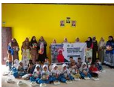
Gambar 5. Foto Bersama

Sebagai penutup dari rangkaian kegiatan, dilakukan pembagian hadiah kepada anak-anak dan sesi foto bersama sebagai bentuk apresiasi atas partisipasi dan semangat mereka dalam mengikuti kegiatan. Anak-anak terlihat sangat bahagia ketika menerima hadiah yang diberikan. Kegiatan ini tidak hanya memberikan kebahagiaan bagi anak-anak, tetapi juga menjadi motivasi agar mereka tetap semangat dalam belajar dan menjalani aktivitas sehari-hari.