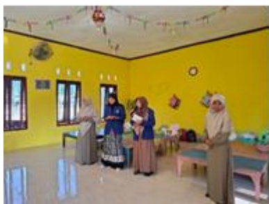
Gambar 2. Pembukaan dan Perkenalan Diri

Pendekatan awal melalui sapaan dan interaksi yang ramah merupakan bagian penting dalam kegiatan trauma healing bagi anak-anak yang terdampak bencana. Anak-anak yang mengalami peristiwa bencana sering kali menunjukkan perubahan perilaku seperti rasa takut, cemas, atau menarik diri dari lingkungan sosial. Oleh karena itu, pendekatan yang dilakukan harus bersifat persuasif, penuh empati, dan menyenangkan agar anak-anak dapat kembali merasa aman dan percaya diri dalam berinteraksi dengan orang lain. Menurut Hidayati (2018), kegiatan trauma healing pada anak pascabencana dapat dilakukan melalui pendekatan yang menyenangkan, seperti interaksi sosial yang hangat, permainan edukatif, dan kegiatan kreatif yang mampu membantu anak mengekspresikan perasaan mereka secara positif.