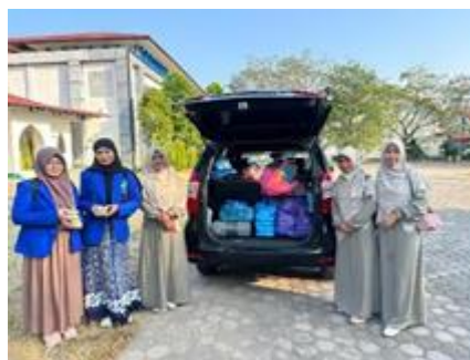
Gambar 1. Foto bersama tim dan guru seelum melaksanakan kegiatan trauma healing

Bencana banjir yang melanda daerah Aceh Tamiang sebelumnya telah menjadi dampak yang terhadap kehidupan masyarakat, termasuk anak-anak usia dini. Selain kerugian material, bencana juga memengaruhi kondisi psikologis anak, seperti munculnya rasa takut, cemas, serta berkurangnya rasa aman. Oleh karena itu, kegiatan pendidikan nonformal yang bersifat menyenangkan dan interaktif sangat diperlukan sebagai bagian dari proses trauma healing bagi anak-anak. Hasiana (2020) menyatakan bahwa trauma adalah peristiwa yang sangat tidak menyenangkan yang dapat mengganggu fungsi fisik dan mental seseorang, terutama pada anak-anak. Menerima adalah kunci penyembuhan trauma (Salamor et al., 2020). Trauma healing membantu anak-anak menjadi lebih siap untuk masa depan karena mereka tidak akan mengingat peristiwa buruk (Fitriyah et al., 2021). Terapi trauma harus diterapkan pada orang tua, remaja, dan masyarakat secara keseluruhan (Septiani Ari et al., 2023). Pendidikan nonformal dalam situasi bencana tidak hanya membantu anak belajar, tetapi juga membantu mereka pulih secara emosional sehingga mereka dapat kembali berinteraksi dengan lingkungan sekitarnya secara positif.