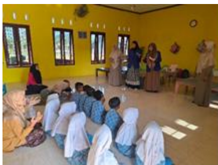
Gambar 4. Ice Breaking/Permainan

Kegiatan selanjutnya adalah membaca doa bersama sebelum penutupan dan sesudah kegiatan bercerita, yang bertujuan untuk menanamkan nilai-nilai spiritual sekaligus memberikan ketenangan batin bagi anak-anak. Doa bersama dilakukan dengan bimbingan dari tim pengabdian serta guru yang turut hadir dalam kegiatan tersebut. Kegiatan ini diharapkan dapat menumbuhkan rasa syukur serta memberikan ketenangan psikologis bagi anak-anak setelah mengalami peristiwa bencana.