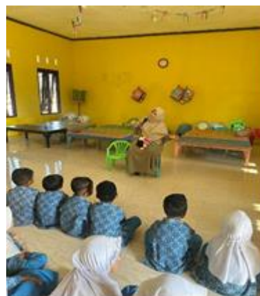
Gambar 3. Kegiatan Bercerita

kebersamaan, dan semangat dalam menghadapi kesulitan. Cerita yang disampaikan dengan ekspresi menarik dan bahasa yang sederhana mampu menarik perhatian anak-anak sehingga mereka dapat menyimak dengan baik. Hal ini sejalan dengan pendapat Madyawati (2017) yang menyatakan bahwa kegiatan bercerita dapat merangsang perkembangan bahasa, imajinasi, serta kemampuan sosial emosional anak usia dini.