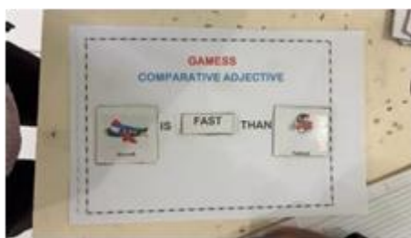
Gambar 4 . Lkpd comparative adjective

bahasa Inggris. Interaksi antara guru dan siswa berlangsung lebih dinamis, sehingga tercipta lingkungan belajar yang kondusif dan partisipatif. Dengan demikian, penggunaan media gambar dan YouTube dalam pembelajaran kosakata memberikan kontribusi nyata terhadap peningkatan kualitas proses pembelajaran serta hasil belajar siswa secara menyeluruh.