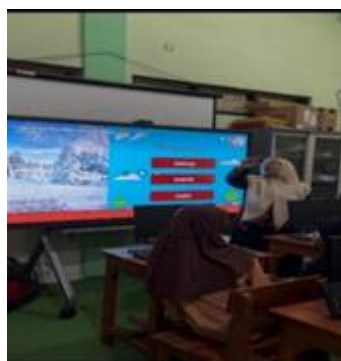
Gambar 3. Siswa memilih jawaban yang benar berdasarkan gambar

menerjemahkan kalimat deskriptif tentang hewan yang telah dipelajari. Beberapa siswa bahkan terlihat berinisiatif menjawab sebelum ditunjuk, yang menunjukkan tingginya keterlibatan siswa dalam kegiatan pembelajaran. Proses pembelajaran berlangsung secara interaktif dan partisipatif, ditandai dengan adanya komunikasi dua arah antara guru dan siswa. Interaksi tidak hanya terjadi dalam bentuk tanya jawab, tetapi juga melalui respons siswa terhadap jawaban teman-temannya. Dengan demikian, siswa tidak lagi berperan sebagai pendengar pasif, melainkan terlibat secara aktif dalam proses pembelajaran. Keaktifan tersebut mencerminkan adanya peningkatan motivasi belajar serta berkembangnya rasa percaya diri siswa dalam menggunakan bahasa Inggris secara lisan di depan kelas.