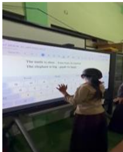
Gambar 2. Siswa menerjemahkan kalimat bahasa Inggris ke bahasa Indonesia

disajikan. Siswa tampak fokus memperhatikan setiap gambar yang muncul di layar, bahkan beberapa di antaranya menunjukkan ekspresi antusias dengan menunjuk gambar serta mencoba menyebutkan nama hewan tersebut secara spontan dalam bahasa Inggris. Respons alami ini menunjukkan adanya keterlibatan awal yang positif dalam proses pembelajaran. Kondisi tersebut mengindikasikan bahwa penggunaan media gambar tidak hanya berfungsi sebagai alat bantu visual, tetapi juga efektif dalam membangun kesiapan belajar dan meningkatkan konsentrasi siswa. Selain itu, karakteristik gambar yang konkret dan kontekstual membantu siswa mengaitkan kosakata baru dengan representasi visual yang jelas, sehingga mempermudah proses pemahaman dan memperkuat daya ingat terhadap kosakata yang diperkenalkan.