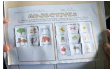
Gambar 7. LKPD Describing an object by size with an adjective

Inggris tersebut, siswa juga menulis terjemahan dalam bahasa Indonesia, yaitu "pesawat lebih cepat daripada becak", yang menunjukkan adanya proses memahami makna secara berbahasa dua. Dokumentasi ini menunjukkan bahwa penggunaan media permainan dan kartu kata dalam tahap pembelajaran sebelumnya berhasil mendorong siswa untuk mencoba menyusun kalimat sendiri. Selain itu, hasil penulisan ini menunjukkan bahwa metode pembelajaran berbasis permainan tidak hanya meningkatkan partisipasi aktif siswa, tetapi juga membantu siswa membangun pemahaman tentang tata bahasa secara perlahan dan bertahap. Kesalahan yang muncul adalah bagian dari proses belajar yang bermanfaat, bisa digunakan untuk melakukan refleksi dan evaluasi agar pemahaman siswa tentang penggunaan comparative adjective menjadi lebih baik.