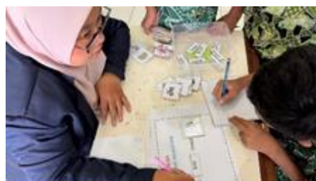
Gambar 5 guru mendampingi siswa dalam proses pengerjaan tugas

bahasa yang biasanya dianggap sulit, terutama bagi siswa sekolah dasar atau yang baru belajar. Selain itu, pendekatan bermain mendorong siswa untuk terlibat secara aktif, bekerja sama, serta berdiskusi dalam membangun kalimat yang tepat. Dengan demikian, media ini bukan hanya membantu proses belajar, tetapi juga menjadi cara yang kreatif dalam menciptakan lingkungan belajar yang lebih menarik, aktif, dan efektif dalam kegiatan pengabdian masyarakat di bidang pendidikan bahasa Inggris.