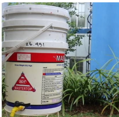
Gambar 4 Komposter Sederhana dari Limbah Polipropilena

Pengenalan dua jenis komposter ini merupakan bentuk intervensi teknologi yang memberikan solusi tepat guna terhadap permasalahan sampah di Desa Tulusbesar. Gambar 4 menunjukkan komposter sederhana. Komposter sederhana dari limbah polipropilena didesain dengan sistem saringan dan kran untuk memisahkan lindi ( leachate ) dengan sampah organik. Hal ini bertujuan untuk mencegah waterlogged pada tumpukan sampah yang memperlambat proses pembusukan (Rakib et al., 2021). Selain itu, desain ini akan mencegah timbulnya bau busuk akibat komponen mayor dalam gas yang dihasilkan, seperti ammonia, volatile organic compound , dan hidrogen sulfida (Andraskar et al., 2021). Pemisahan lindi secara gravitasi menjaga sirkulasi oksigen mikro, sehingga mencegah timbulnya bau busuk akibat pembusukan anaerobik (Nguyen et al., 2022).