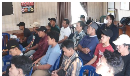
Gambar 2 Suasana pelatihan teknis

Tim pelaksana pengabdian kepada masyarakat menghibahkan alat kepada mitra yang terdiri dari 10 unit