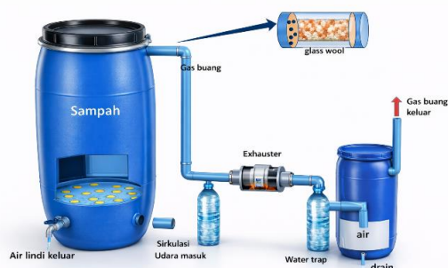
Gambar 5 Skema Rangkaian Komposter Model Biodryer .

Pengenalan dua jenis komposter ini merupakan bentuk intervensi teknologi yang memberikan solusi tepat guna terhadap permasalahan sampah di Desa Tulusbesar. Gambar 4 menunjukkan komposter sederhana. Komposter sederhana dari limbah polipropilena didesain dengan sistem saringan dan kran untuk memisahkan lindi ( leachate ) dengan sampah organik. Hal ini bertujuan untuk mencegah waterlogged pada tumpukan sampah yang memperlambat proses pembusukan (Rakib et al., 2021). Selain itu, desain ini akan mencegah timbulnya bau busuk akibat komponen mayor dalam gas yang dihasilkan, seperti ammonia, volatile organic compound , dan hidrogen sulfida (Andraskar et al., 2021). Pemisahan lindi secara gravitasi menjaga sirkulasi oksigen mikro, sehingga mencegah timbulnya bau busuk akibat pembusukan anaerobik (Nguyen et al., 2022).