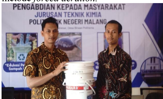
Gambar 3 Penyerahan simbolis alat kepada mitra

komposter sederhana dan 1 unit komposter biodryer . Gambar 3 menunjukkan penyerahan simbolis alat kepada mitra. Hal ini dilakukan sebagai bentuk capaian fisik dan keberlanjutan program. Komposter sederhana didesain spesifik dengan sistem leachate harvest untuk memisahkan fasa padatan dan cairan, sedangkan biodryer dilengkapi dengan exhauster yang memanfaatkan metode forced aeration .