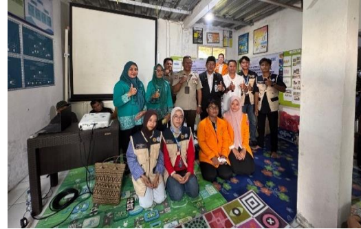
Gambar 4 Sosialisasi Pencegahan Kebakaran Rumah Produksi UMKM