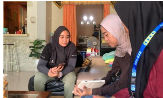
Gambar 1 Observasi UMKM RT. 34

yang bergerak di bidang produksi makanan rumahan. Berdasarkan hasil observasi, ditemukan bahwa manajemen usaha dan aspek keselamatan kerja belum berjalan secara optimal. UMKM belum memiliki identitas visual seperti banner sebagai media promosi, serta pemasaran masih dilakukan secara sederhana melalui komunikasi dari mulut ke mulut. Dari sisi keselamatan kerja, belum tersedia media edukasi mengenai potensi bahaya di area produksi, seperti bahaya kebakaran dan penggunaan alat pelindung diri (APD) belum diterapkan secara konsisten.