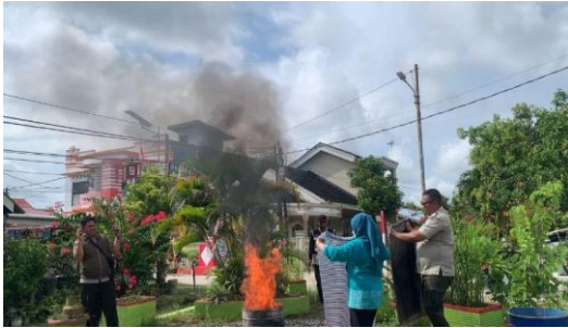
Gambar 2 Melaksanakan Edukasi Kebakaran