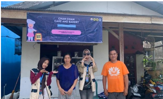
Gambar 3 Pemasangan Banner Promosi UMKM

Hasil setelah pelaksanaan program menunjukkan adanya peningkatan pemahaman dan kesadaran pemilik serta pekerja terhadap pentingnya manajemen usaha dan keselamatan kerja. UMKM kini memiliki identitas usaha yang lebih profesional dan media promosi yang dapat digunakan untuk memperluas pemasaran. Selain itu, pekerja menjadi lebih sadar terhadap potensi bahaya di area produksi dan mulai menerapkan penggunaan APD secara lebih konsisten. Secara keseluruhan, program ini memberikan dampak positif dalam mendukung pengelolaan usaha yang lebih tertata dan lingkungan kerja yang lebih aman serta berkelanjutan. Hasil pengabdian ini sejalan dengan (Wijayanti et al., 2021).