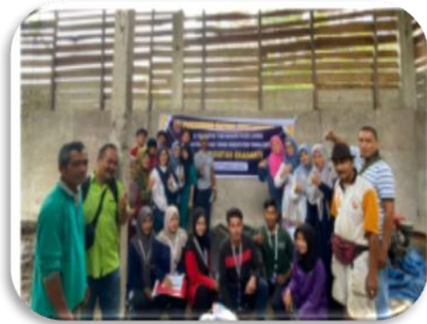
Gambar 5. Foto Bersama

dokumentasi pelaksanaan program pada Gambar 5.