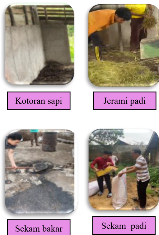
Gambar 3. Bahan Yang Disiapkan