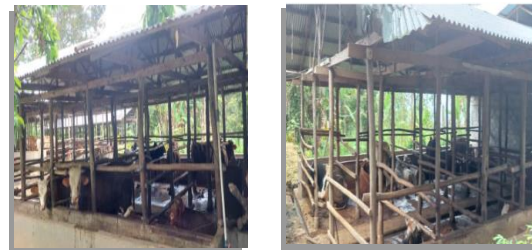
Gambar 2. Kandang Sapi Mitra

Tahap awal untuk identifikasi dan persiapan mencakup beberapa hal, seperti: penentuan waktu dan lokasi kegiatan, jumlah peserta, konsumsi bagi peserta pelatihan, persiapan alat dan bahan yang diperlukan untuk pelatihan, materi, total materi pelatihan, cara menyampaikan materi, dan hal-hal lainnya. Proses ini dilaksanakan oleh mahasiswa KKN tematik bersama dengan kelompok tani lokal. Pada Gambar 2 tampak kandang sapi dari mitra.