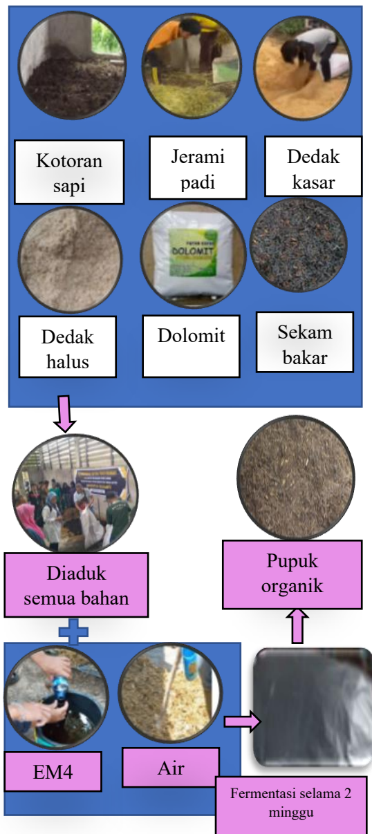
Gambar 4. Pembuatan Pupuk Organik

meningkatkan kualitasnya. Fungsi dedak halus adalah sebagai bahan aditif atau sumber carbon untuk makanan mikro organisme, dan mempertahankan kelembaban. Kegiatan ini juga memberikan wawasan baru bagi para petani karena meskipun selama ini mereka belum mengetahui cara yang tepat untuk memproduksi pupuk organik. Pendekatan tersebut sesuai dengan prinsip pembelajaran dewasa (andragogi) yang menekankan nilai dari pengalaman langsung dan relevansi konteks dalam proses pendidikan (Muhartini dan Bakar, 2023).