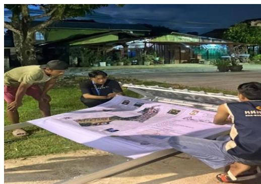
Gambar 2. Pemasangan Peta Digital

Tahap pemasangan dilakukan pada lokasi strategis yang mudah dijangkau dan terlihat oleh warga maupun pengunjung, seperti area pos ronda atau titik pusat aktivitas masyarakat. Setelah pemasangan, dilakukan uji coba pemindaian barcode untuk memastikan akses menuju peta digital berjalan dengan baik. Tahapan ini penting untuk menjamin berfungsinya smart sistem sebelum disosialisasikan kepada masyarakat.