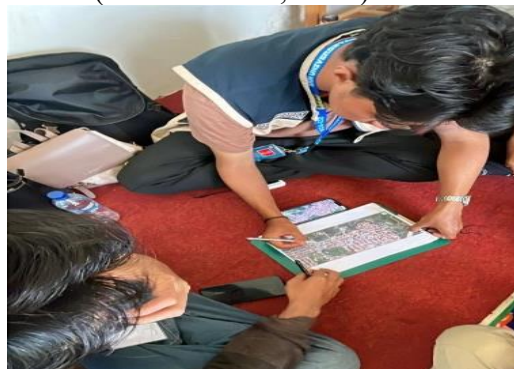
Gambar 1. Mengidentifikasi Batas Wilayah RT 59

Tahap awal kegiatan diawali dengan observasi lapangan untuk mengidentifikasi batas wilayah RT, jaringan jalan, fasilitas umum, serta titik penting lainnya. Pengumpulan data dilakukan melalui survei langsung, dokumentasi visual, serta wawancara dengan pengurus RT dan tokoh masyarakat. Teknik ini digunakan untuk memperoleh data spasial dan non spasial yang valid, sebagaimana diterapkan dalam penelitian pemetaan wilayah desa berbasis SIG yang menekankan pentingnya verifikasi lapangan dalam menghasilkan peta yang akurat (Karmila et al., 2025).