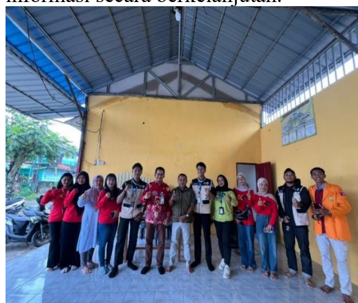
Gambar 3. Sosialisasi dan edukasi cara penggunaan dan pemanfaatan barcode peta digital.

Tahap akhir kegiatan adalah sosialisasi dan edukasi kepada warga mengenai cara penggunaan barcode serta manfaat peta digital bagi lingkungan. Edukasi ini bertujuan meningkatkan literasi digital masyarakat serta mendorong pemanfaatan teknologi informasi dalam kehidupan sehari-hari. Pendekatan sosialisasi terbukti efektif dalam meningkatkan pemahaman masyarakat terhadap penggunaan teknologi digital berbasis komunitas (Susanti et al., 2025). Dengan demikian, metode pelaksanaan ini tidak hanya menghasilkan produk peta digital berbasis barcode , tetapi juga membangun kapasitas masyarakat dalam memanfaatkan teknologi informasi secara berkelanjutan.