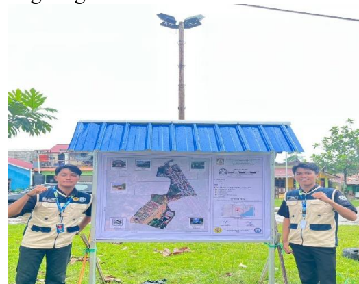
Gambar 5. Hasil pemasangan Peta Digital Berbasis Barcode RT 59.

bahwa barcode UMKM dapat diakses dengan mudah menggunakan smartphone dan menampilkan informasi usaha secara cepat dan responsif. Masyarakat yang memindai kode dapat langsung mengetahui jenis usaha yang tersedia di sekitar mereka, seperti usaha kuliner rumahan, jasa jahit, warung sembako, dan usaha kerajinan. Kemudahan akses ini meningkatkan visibilitas UMKM dan membuka peluang peningkatan transaksi di tingkat lingkungan.