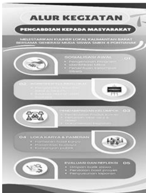
Gambar 1. Alur Kegiatan

Kemudian, data dianalisis secara deskriptif untuk menilai ketercapaian tujuan dan dampak kegiatan terhadap peserta. Berikut adalah alur kegiatan abdimas