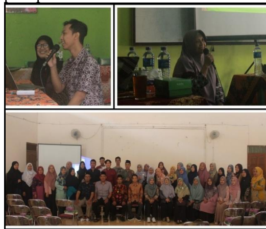
Gambar 2. Sesi penyampaian materi dan foto bersama peserta.

Berikut dokumentasi penyampaian materi serta foto bersama para peserta.