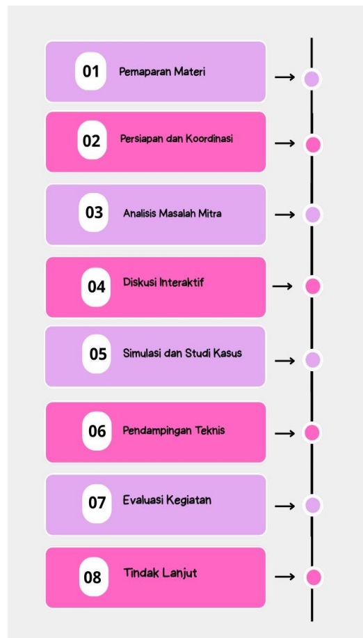
Gambar 2. Metode Kegiatan

Metode yang digunakan dalam kegiatan Pengabdian Kepada Masyarakat (PKM) ini adalah pendekatan partisipatif dan kolaboratif yang berfokus pada peningkatan kapasitas guru melalui sosialisasi Sistem Penjaminan Mutu Pendidikan (SPMP) dan implementasi pembelajaran yang berorientasi pada peserta didik di MIN Fakkak. Pelaksanaan kegiatan dilakukan melalui beberapa tahapan yang saling berkaitan dan berkesinambungan.