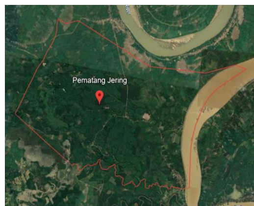
Gambar 1: Lokasi Desa Pematang Jering, Kabupaten Muaro Jambi

Menurut data Badan Pusat Statistik (BPS), curah hujan di kabupaten Muaro Jambi mencapai 3337,6 mm per tahun dengan jumlah hari hujan sebanyak 240 hari per tahun (Badan Pusat Statistik, 2023). Meninjau topologi Desa Pematang Jering yang berada di bantaran sungai, potensi banjir yang terjadi sangat besar. Saat curah hujan naik, ketinggian air akan naik sehingga menyebabkan banjir. Air banjir yang mengalir dari perkebunan akan mengarah ke pemukiman warga.