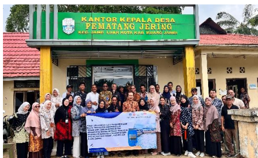
Gambar 4: Dokumentasi pelaksanaan kegiatan pengabdian kepada masyarakat

diketahui memiliki kemampuan untuk mengikat zat kimia dari air. Filter air sederhana memang mampu menghilangkan pengotor, namun filter air sederhana tidak mampu menahan zat pengotor yang memiliki ukuran mikro. Filter air sederhana juga tidak mampu menghilangkan zat kimia karena filter air sederhana tidak memiliki media filter yang mampu mengikat zat kimia. Dari segi keberlanjutan, filter air modern memiliki kemampuan untuk diregenerasi. Pasir silika pada filter air sederhana dapat dibersihkan dengan air untuk menghilangkan zat pengotor yang terperangkap dalam pori silika. Karbon aktif dapat dibersihkan dari kontaminan kimia dengan proses pencucian serta penjemuran dengan panas untuk mengembalikan kemampuan untuk mengikat zat kimia.