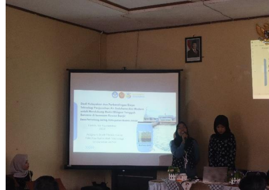
Gambar 3: Sosialisasi teknologi penjernih air kepada Masyarakat Desa Pematang Jering, Kabupaten Muaro Jambi

analisis, teknologi penjernih air layak didirikan. Perhitungan biaya pembangunan filter penjernih air turut disosialisasikan.