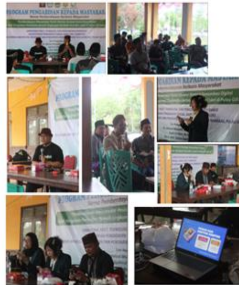
Gambar 2 Proses pemetaan dan penyampaian materi

Masyarakat, terutama para pemuda, mulai merasakan kebanggaan terhadap budaya dan tradisi lokal yang sebelumnya tidak dipandang sebagai aset wisata. Pembahasan tentang aksara Carakan Madura, rumah adat, ritual tradisional, dan kuliner lokal muncul sebagai ide konten yang ingin mereka tonjolkan. Hal ini sejalan dengan pemikiran Pike (2016) bahwa branding destinasi yang kuat harus mengangkat nilai-nilai budaya yang unik dan tidak dapat ditemukan di tempat lain. Dinamika kegiatan juga menunjukkan bahwa masyarakat semakin memahami pentingnya konsistensi dalam strategi komunikasi digital. Pada awalnya, mereka hanya mengunggah konten tanpa mempertimbangkan waktu, jenis konten, atau audiens. Namun setelah pendampingan, masyarakat mulai menyusun jadwal unggahan serta memahami bahwa algoritma media sosial memiliki pola tertentu yang dapat dimanfaatkan untuk meningkatkan jangkauan promosi. Temuan ini mengonfirmasi penjelasan Leung et al. (2013) mengenai pentingnya strategi dalam pengelolaan media digital destinasi