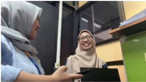
Gambar 1. Dokumentas Wawancara