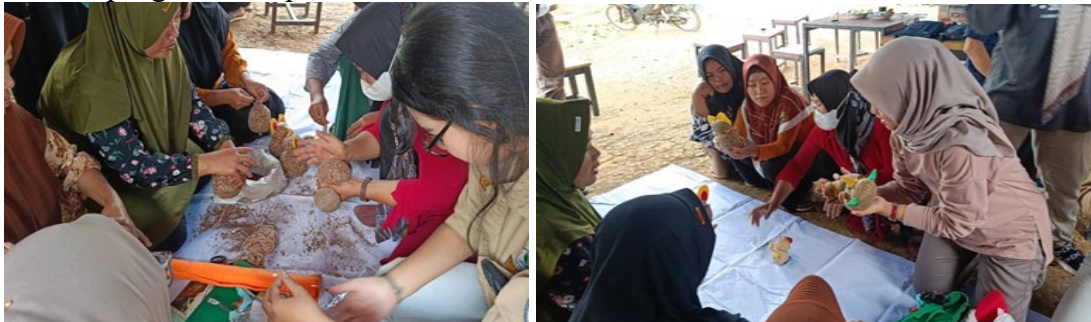
Gambar 2. Pembuatan Mainan Edukasi dari Limbah Kulit Buah Kopi

Tahapan pembuatan mainan edukasi yaitu dengan cara menyiapkan stocking , diisi dengan bibit rumput atau bibit padi kemudian diisi dengan kompos kulit kopi. Setelah diisi dengan kompos maka dibentuk karakter sesuai yang diharapkan