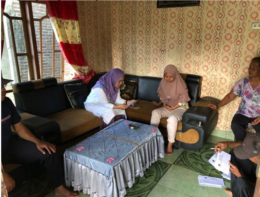
Gambar 1. Kegiatan pra survey

tahap yang sangat menentukan Bagian hasil dan pembahasan berisi paparan hasil analisis yang berkaitan dengan pertanyaan pengabdian. Setiap hasil pengabdian harus dibahas. Pembahasan berisi pemaknaan hasil dan perbandingan dengan teori dan/atau hasil pengabdian sejenis. Panjang paparan hasil dan pembahasan 40-60% dari total panjang artikel.