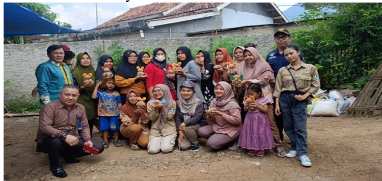
Gambar 3. Peserta pembuatan Mainan Edukasi dan Tim PKM

Gapoktan wanaraya untuk mencoba di rumah sehingga jika masyarakat tertarik (Gambar 3)