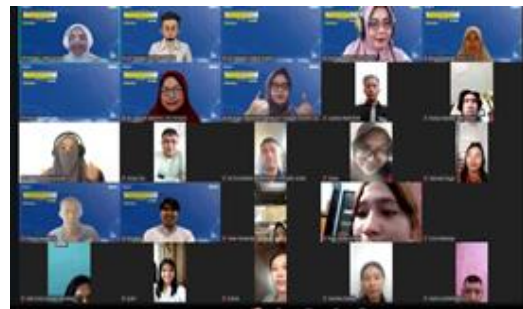
Gambar 3. Tampilan Peserta PkM Daring

Dari tabel diatas dapat dianalisis bahwa terjadi peningkatan signifikan pada seluruh aspek penilaian. Peningkatan tertinggi terdapat pada pemahaman mekanisme pelaporan (35%) menunjukkan bahwa sebelumnya peserta memiliki keterbatasan dalam mekanisme pelaporan. Secara rata-rata, terjadi peningkatan sekitar ± 31% yang dapat menunjukkan efektivitas kegiatan edukasi.