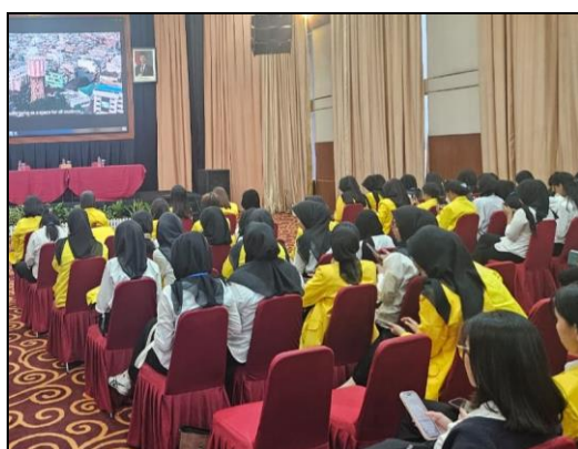
Gambar 5. Peserta PkM Luring mengerjakan Post-Test

Melalui kemampuan peserta dalam pemahaman terhadap studi kasus, diukur dari kemampuan mengidentifikasi bentuk kekerasan, analisis penyebab kekerasan, menentukan langkah pencegahan dan tindakan penanganan, menunjukkan bahwa metode simulasi dan studi kasus efektif dalam meningkatkan kemampuan praktis peserta dalam mengidentifikasi kasus, mengambil keputusan dan respon terhadap situasi nyata.