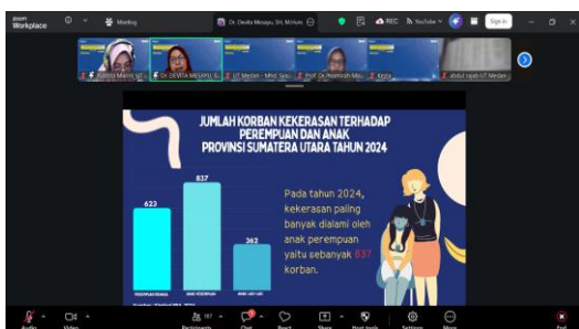
Gambar 4. Studi Kasus Kekerasan

Sebagian besar peserta yang mengikuti kegiatan ini tergolong aktif (42%) dan sangat aktif (31%), hal ini menunjukkan bahwa metode partisipatif dan responsif seperti diskusi dan simulasi kasus mampu meningkatkan keterlibatan peserta secara signifikan.