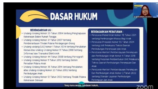
Gambar 4. Materi Dasar Hukum

Untuk menunjukkan tingkat partisipasi peserta melalui pendekatan partisipatif dan responsif dapat dilihat pada tabel dibawah ini: