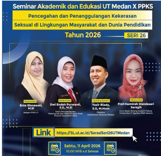
Gambar 2: Poster & Narasumber Kegiatan

dilakukan melalui Unit Pelaksana Teknis Daerah (UPTD) Dinas Pemberdayaan Perempuan dan Perlindungan Anak (PPPA) Provinsi Sumatera Utara.