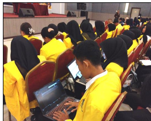
Gambar 5. Peserta PkM Luring simulasi pelaporan kasus dipandu anggota abdimas