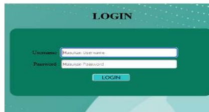
Gambar 1. Login

Lakukan ini – lakukan tindakan ini. Perusahaan yang tidak bertanggung jawab, yang bisa membantu anda dalam mengerjakan pekerjaan yang tidak dapat diselesaikan, ada yang masuk SMK Negeri 2 Padang di bangku SMA. Petunjuk Penting untuk Dicatat di Catatan Penting Anda, seperti yang Anda katakan, Anda dapat mengakses WhatsApp, dan Anda dapat menggunakan ponsel Anda untuk nomor tersebut. Pelanggan Yang Mungkin Bertanggung Jawab Mengelola Layanan Pelanggan Lainnya Jika ingin menggunakan aplikasi, Anda dapat mengatur ulang aplikasi tersebut.