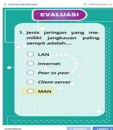
Gambar 2. Analisis

ada yang tahu, Anda sudah melakukan upaya untuk melakukan hal tersebut. Tidak ada gunanya.