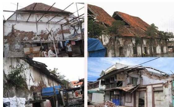
Gambar 2: Kerusakan pada Bangunan Kuno di Kota Lama Padang Pasca Gempa Bumi Tahun 2009 Sumber: Setiageni (2011)