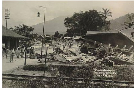
Gambar 1: Kerusakan pada Stasiun Padang Panjang Akibat Gempa Bumi tahun 1926

menghilangkan cagar budaya, seperti hancurnya Stasiun Padang Panjang, Sumatera Barat dan hanya menyisakan dinding-dinding, serta hancurnya Pasar Serikat Padangpanjang Batipuh X Koto akibat gempa tektonik tahun 1926. Kemudian, gempa bumi yang menimpa wilayah Padang dan Padang Pariaman pada tahun 2009 juga mengakibatkan banyak cagar budaya yang rusak dan hancur. Berikut adalah gambaran kerusakan cagar budaya tersebut: