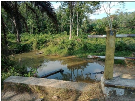
Gambar 1. Air sungai SAD Lubuk Kayu Aro

Air sungai yang dimanfaatkan jika dilihat secara kasat mata agak keruh, dan sedikit berbau. Pada saat kemarau keberadaan air sungai ini menjadi tumpuan masyarakat terlihat pada Gambar 1.