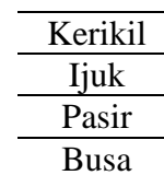
Gambar 2. Media penyaring sederhana

Media penyaring yang digunakan terdiri dari botol air, kerikil, ijuk, pasir, dan busa. Dari atas ke bawah, ukuran partikel dari media penyaring semakin kecil. Media penyaring dapat dilihat pada Gambar 2.