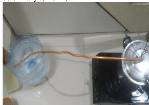
Gambar 3. Proses Destilasi Ampas Jahe

Dalam kegiatan pendampingan ini, ampas yang awalnya dianggap tidak memiliki manfaat dan memiliki nilai jual yang cukup tinggi (W Sukmawati & Sunaryo, 2021).