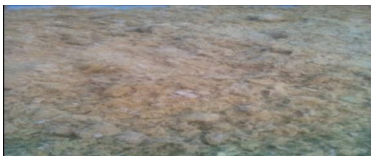
Gambar 2. Limbah Ampas Jahe