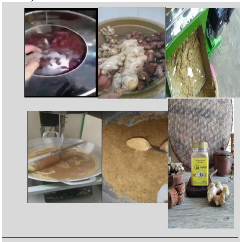
Gambar 1. Pengolahan Serbuk Jahe

Usaha mikro minuman serbuk jahe instan JM HAMKA adalah sebuah usaha yang dikembangkan secara mandiri oleh warga desa Dukuh Jeruk kecamatan Karangampel kabupaten Indramayu sebagai usaha pengembangan perekonomian warga. Kelompok usaha minuman serbuk jahe instan ini berdiri pada tahun 2018 seperti yang tertulis pada surat keterangan usaha dari desa setempat dengan nomor: 510/377 Ekbang. Selain itu kelompok usaha ini juga sudah memiliki standar kelayakan dari dinas kesehatan Indramayu dengan dikeluarkannya sertifikat PIRT nomor 2133212010767-25. Kelompok usaha ini terdiri atas 5 orang ibu rumah tangga yang menggantungkan pendapatannya hanya dari penjualan minuman serbuk jahe instan ini untuk membantu ekonomi keluarga (Pezzini, 2020).