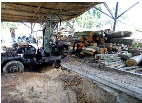
Gambar 1: Melimpahnya serbuk gergaji kayu disekitar Desa Duyung

Pada sektor bidang agrowisata terdapat wahana kebun durian yang diterapkan sebagai wisata petik durian yaitu Duyung Trawas Hill . Wisata tersebut berlokasi di Desa Duyung Kecamatan Trawas Kabupaten Mojokerto. Bertepatan dengan lokasi tersebut, terdapat kelompok petani budidaya jamur tiram yang dikelola oleh Bapak Wardoyo selaku ketua kelompok. Ironisnya, hasil produksi petani jamur tiram di lingkungan Kecamatan Trawas khususnya di Desa Duyung tidak pernah dilibatkan didalam sektor pariwisata, terbengkalai dan tidak dikelola dengan baik. Padahal dari kebutuhan bahan baku serbuk gergaji kayu sebagai pembuatan baglog sangat melimpah. Karena Trawas merupakan daerah yang dikelilingi hutan tropis yang masih terjaga produktifitas penghasil kayu.