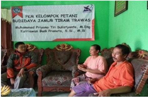
Gambar 5: Koordinasi kegiatan sebelum dilakukan demonstrasi plot (DEMPLOT) penggunaan mesin Steamer

dalam pelaksanaan kegiatan demonstrasi, menyediakan tempat dan perlengkapan penunjang kegiatan.