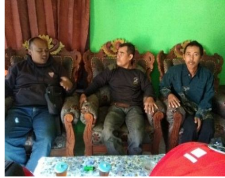
Gambar 3: Sharing dan diskusi.

Sebelum dilakukan proses rancang bangun mesin steamer , tim pengabdian melakukan kegiatan koordinasi dengan pihak mitra seperti yang ditunjukkan pada Gambar 3.