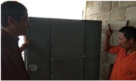
Gambar 7: Monev efektifitas penggunaan mesin

mesin baik secara teknis maupun secara teoritis.