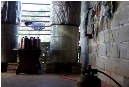
Gambar 2: Keadaan mesin steamer sebelum dilakukan pengabdian masyarakat.

perlakuan sentuhan tangan manusia. Tentunya hal ini sangat tidak efektif, saat terjadi penguapan udara, plastic mengalami pemuaiian hingga menggelembung tak terkendali terkadang sampai timbul bunyi ledakan. Ledakan mesin tersebut hingga terdengar warga sekitar proses produksi baglog. Hal ini yang menyebabkan warga sekitar Desa Duyung enggan untuk berwirausaha dalam bidang budidaya jamur. Akibat ledakan tersebut, mesin steamer mempunyai lubang yang cukup besar yang memungkinkan udara dari luar mesin bisa masuk kedalam baglog untuk mengkontaminasi bibit jamur. Pada akhirnya baglog jamur menjadi rusak tidak dapat dipakai dan proses produksi baglog dihentikan malah beralih membenahi mesin steamer.