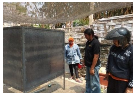
Gambar 4: Perakitan mesin Steamer masih dalam progress 50%.

Tindak lanjut hasil kegiatan survey alat dan bahan tersebut telah didapatkan lokasi pembuatan mesin steamer dan segera dilakukan proses perakitan mesin sesuai dengan kesepakatan desain dengan pihak mitra. Hasil perakitan dari desain yang telah disepakati dengan pihak mitra seperti yang ditunjukkan pada Gambar 4.