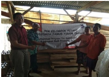
Gambar 8. Kegiatan serah terima mesin Steamer kepada Mitra

Sejalan dengan serangkaian kegiatan evaluasi dan monitoring, tim pengabdi melanjutkan dengan kegiatan serah terima mesin steamer Hasil dari kegiatan tersebut seperti yang ditunjukkan pada Gambar 8.