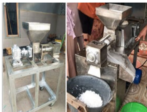
Gambar 1 Mesin Parut & Peras Santan

kelapa ini kemudian akan digunakan sebagai bahan dasar dalam pembuatan santan kelapa. Teknologi Peras Santan Kelapa menggunakan mesin peras otomatis yang dirancang khusus pekerja disabilitas. Mesin parut memiliki dimensi 20 x20, dengan tinggi 30 cm, Dinamo penggerak 220 v/50 Hz dengan kecepatan 2800putaran, 25-30 butir per jam. Untuk mesin peras santan dimensinya dengan panjang 105 cm, Lebar 48 cm dan tinggi 100 cm, dengan memanfaatkan mesin penggerak dinamo elektro 2 hp.