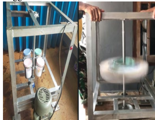
Gambar 2 Mesin Sentrifugal VCO

tabung dimana masing-masing tabung berisi 250 ml santan sehingga dalam waktu 20 menit /siklus mesin dapat memisahkan 1000ml Santan. Mesin ini bekerja dengan memanfaatkan gaya sentrifugal yang dihasilkan dari putaran tabung centrifugal pada kecepatan tinggi.