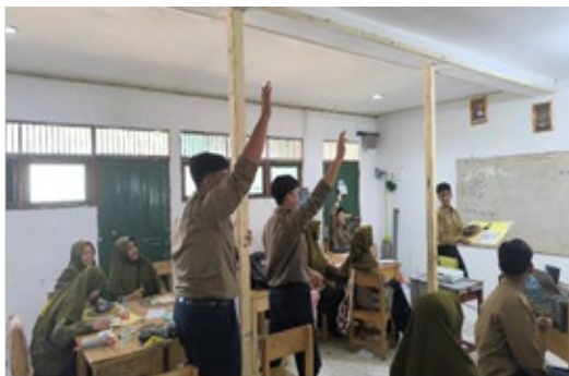
Gambar 5. Sesi Tanya Jawab dengan Siswa