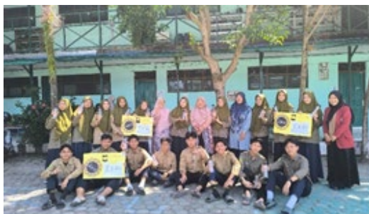
Gambar 7. Foto Bersama dengan Siswa

Tahap ketiga merupakan sesi tanya jawab antara pemateri dan peserta mengenai hal-hal yang dirasa masih belum jelas oleh peserta pada saat menggunakan media INTEL. Kemudian dilanjutkan dengan menjawab soal kuis secara berkelompok dan maju untuk mempresentasikan cara menemukan jawabannya menggunakan media INTEL.