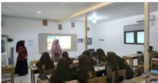
Gambar 1. Pemaparan Materi Integral dan Media INTEL

Tahap pertama yaitu penjelasan materi yang dimulai dari konsep integral. Penjelasan ini bertujuan mengingatkan siswa terkait materi turunan terlebih dahulu yang kemudian dikaitkan dengan konsep integral itu sendiri. Kemudian menjelaskan media pembelajaran INTEL. Penjelasan ini bertujuan untuk memberikan informasi tentang bagian-bagian dari media ini yang terdiri dari lingkaran besar menunjukkan tempat pangkat, lingkaran sedang menunjukkan tempat koefisien, dan lingkaran kecil untuk mengetahui hasil integralnya, dan tempat soal kuis serta tempat menulis soal dan jawaban.