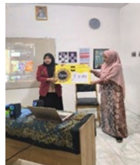
Gambar 3. Demonstrasi Penggunaan Media INTEL

Tahap kedua yaitu demonstrasi penggunaan media INTEL oleh mahasiswa secara langsung. Mahasiswa menunjukkan video tutorial cara penggunaan INTEL dan menjelaskan cara penggunaan media dengan menggunakan soal kuis yang sudah terdapat pada media dan. Kemudian pada tahap ini juga, siswa akan dikelompokkan dalam 3 kelompok yang terdiri dari 6-5 orang. Setelah itu siswa akan diberikan kesempatan untuk menggunakan media INTEL secara berkelompok dalam menemukan konsep integral.