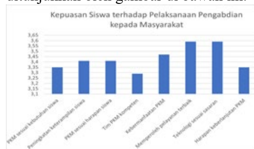
Gambar 8. Kepuasan Siswa terhadap Pelaksanaan Pengabdian kepada Masyarakat

Hasil evaluasi terkait pengabdian ini diperoleh melalui pemberian angket kepuasan siswa terhadap pelaksanaan pengabdian yang ditunjukkan oleh gambar di bawah ini.