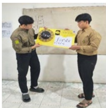
Gambar 6. Siswa Mempresentasikan Jawaban Mewakili Kelompoknya