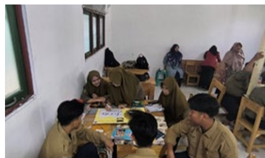
Gambar 4. Salah Satu Kelompok yang Mencoba Menggunakan Media INTEL