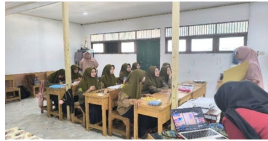
Gambar 2. Siswa Menyimak Materi

Tahap kedua yaitu demonstrasi penggunaan media INTEL oleh mahasiswa secara langsung. Mahasiswa menunjukkan video tutorial cara penggunaan INTEL dan menjelaskan cara penggunaan media dengan menggunakan soal kuis yang sudah terdapat pada media dan. Kemudian pada tahap ini juga, siswa akan dikelompokkan dalam 3 kelompok yang terdiri dari 6-5 orang. Setelah itu siswa akan diberikan kesempatan untuk menggunakan media INTEL secara berkelompok dalam menemukan konsep integral.