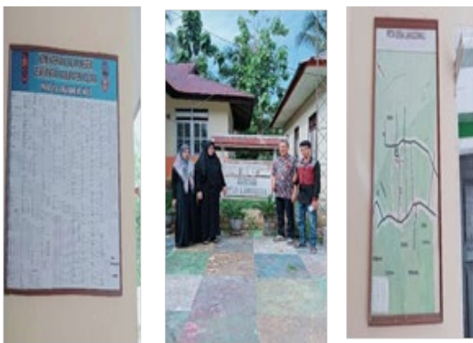
Gambar 1. Desa Langgomali sebagai Lokasi Mitra Pemberdayaan Desa Binaan Universitas Muhammadiyah Kendari

Desa Langgomali bertindak sebagai Mitra Pemberdayaan Desa Binaan (PDB) di bawah naungan Universitas Muhammadiyah Kendari, yang melambangkan upaya kolaboratif dan dukungan yang diberikan untuk meningkatkan kondisi sosial ekonomi penduduk desa (Gambar 1). Sangat penting untuk menerapkan intervensi strategis dengan urgensi untuk memperbaiki kondisi pertanian kakao di Desa Langgomali, sehingga memastikan keberlanjutan dan memaksimalkan manfaat bagi petani dan masyarakat lokal yang lebih luas.