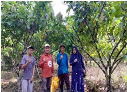
Gambar 3. Lokasi Mitra yang akan di Jadikan Pilot Project

Selain itu, tahap persiapan ini menetapkan kesepakatan mengenai jadwal pelaksanaan pelatihan teoritis dan praktis yang berkaitan dengan perkebunan kakao, yang digantikan oleh pemberdayaan petani kakao melalui adopsi Integrated Farming System (IFS) sejalan dengan prinsip-prinsip Ekonomi Hijau yang bertujuan untuk budidaya kakao berkelanjutan (Gambar 3)