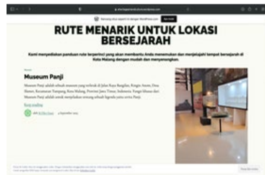
Gambar 2 : Website Digital History

Link Youtube Digital History : https://www.youtube.com/@HistoryFieldTripMalang