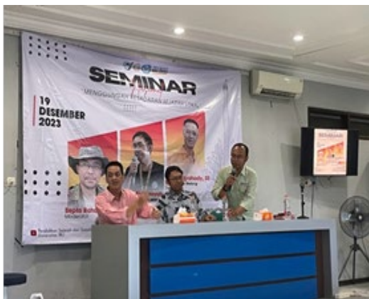
Gambar 3 : Seminar Menggugah Kesadaran Sejarah Lokal di Kota Malang

3. Pengembangan kampanye pemasaran melalui Digital History Seri Ken Dedes: dimana Jelajah Jejak Malang melalui digital history seri Ken Dedes yang disebarluaskan melalui media social dan youtube dapat menjadi salah satu media dalam mempromosikan wisata kesejarahan Kota Malang melalui cerita-cerita Ken Dedes.