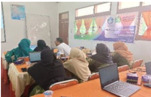
Gambar 1. Salah satu Tim PkM mendampingi Peserta Workshop