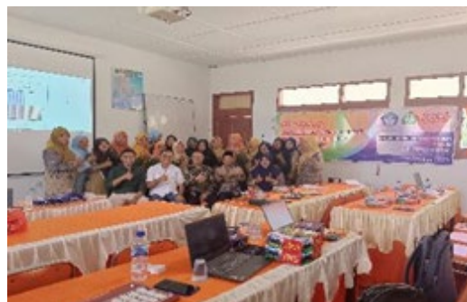
Gambar IV. Tim PkM dan Peserta Workshop

Setelah peserta selesai presentasi produk lembar kerja eksploratif, tim PkM memberikan masukan terkait semua aspek yang telah didesain, mulai dari pemilihan urutan tampilan elemen menu, dan aktivitas lain. Kegiatan ini dijadikan sebagai evaluasi produk oleh tim PkM. Berdasarkan masukan tim PkM, peserta mengrevisi produk masing-masing.