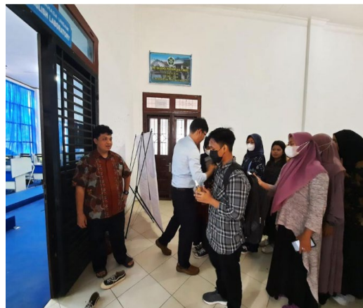
Gambar 4. Penjelasan Sebelum Tes

peluang usaha poster stiker bertopik TOEFL.