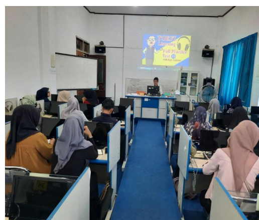
Gambar 5. Tahap Pelatihan Tes Toefl TPT

Tahap ini adalah pelatihan dan tes TOEFL TPT pada mitra secara tatap muka di Laboratorium Bahasa. Langkah pertama, tim pengabdian memperkenalkan diri dihadapan mitra dan menjelaskan maksud dan tujuan dilaksanakannya pelatihan. Kemudian, tim pengabdian membagikan bahan pelatihan berupa poster stiker yang berisi teks bilingual berbahasa indonesia dan inggris serta memiliki gambaran berkaitan dengan TOEFL TPT serta dilanjutkan dengan tes.