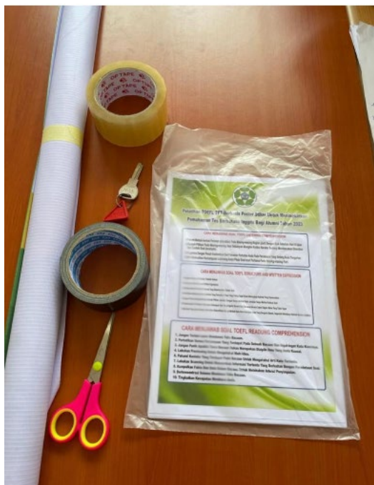
Gambar 3. Tahap Persiapan Bahan dan Alat

kesepakatan bersama tentang penjadwalan dan pemakaian tempat dilaksanakannya program dengan menjunjung protokol kesehatan dan bersifat kekeluargaan. Kemudian, tutor pelatihan mempersiapkan bahan dan alat untuk pengabdian seperti poster stiker yang berisikan informasi untuk menyelesaikan tes TOEFL dengan mudah.