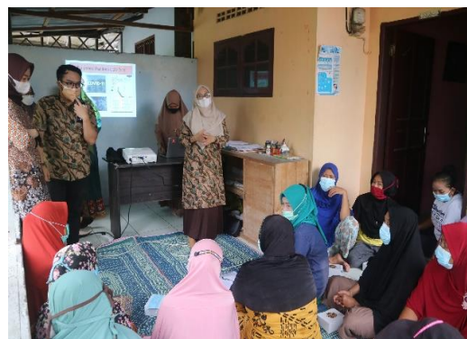
Gambar 3: Diskusi

Kegiatan ini berlanjut dengan pelatihan dalam menggunakan beberapa aplikasi e-commerce seperti shopee, tokopedia dan bukalapak. Pelatihan tersebut dimulai dengan pendaftaran akun e-commerce , kemudian cara menginput barang – barang yang akan di jual, penentuan harga berdasarkan pemotongan administrasi penggunaan aplikasi tersebut, promosi toko, dan laporan penjualan toko. Dari pelatihan ini diharapkan para karyawan dapat efektif dalam bekerja khususnya penjualan online sehingga meningkatkan penjualan UMKM di desa Klambir V.