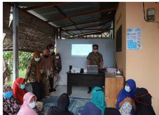
Gambar 3: Kegiatan Penyuluhan

Kegiatan dimulai dengan diskusi antaran tim pengabdian dan para mitra yang mayoritas merupakan pelaku UMKM dengan pembahasan terkait usaha apa saja yang telah berjalan di desa klambir V yang sudah mulai di pasarkan secara offline ataupun online. Hasil diskusi diperoleh data terkait usaha yang sudah berjalan seperti keripik, kue kering, jamu, wajik labu, dan anyaman.