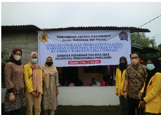
Gambar 2: Pelaksanaan Pengabdian