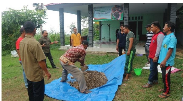
Gambar 3. Proses pencampuran bahan

Perlakuan tersebut dilakukan oleh perwakilan gapoktan untuk mencampurkan semua bahan-bahan, disamping itu pemateri kamu juga memberi penjelasan singkat. Bahan-bahan tersebut dicampur sesuai yang telah ditakar sebelumnya. Seperti, kotoran kambing 5kg, kotoran sapi 5kg, dedak halus 2kg, dan sekam 2kg.