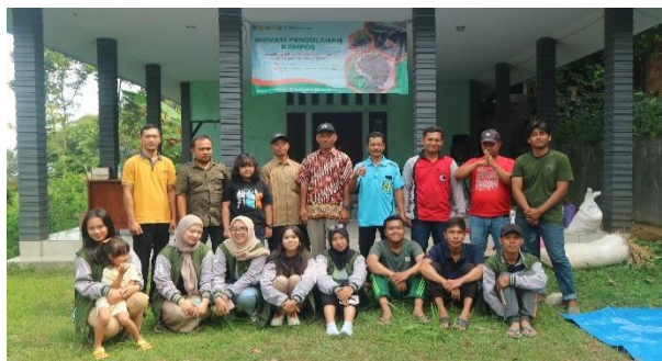
Gambar 2. Foto Bersama dengan peserta penyuluhan

Pupuk bokashi merupakan proses fermentasi dari pupuk kandang atau bahan organik yang dikenal dengan nama pupuk kompos yang memanfaatkan teknologi EM-4. Manfaat dari pupuk bokashi sendiri yaitu: meningkatkan struktur tanah dan meningkatkan kandungan nutrisi yang diperlukan tanah, penggunaan pupuk bokashi membantu mengurangi jumlah limbah organik yang masuk ke tempat pembuangan akhir, pupuk bokashi merangsang pertumbuhan mikroorganisme yang bermanfaat dalam tanah, mempercepat pertumbuhan tanaman. Dalam program kerja Mahasiswa KKN-T MBKM Kelompok 4 Desa Wonomerto tentang inovasi kompos diadakan dengan latar belakang masyarakat yang mayoritas memiliki hewan ternak yang kemudian kotorannya tidak digunakan semestinya dan cenderung tidak bermanfaat. Maka dari itu, Mahasiswa KKNT MBKM Kelompok 4 Desa Wonomerto menggandeng Dinas Pertanian Kabupaten Jombang untuk mengadakan program kerja penyuluhan inovasi kompos bokashi.