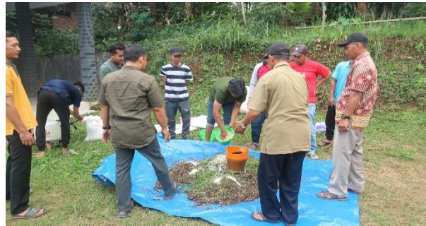
Gambar 4. Proses pencampuran dekomposer

Larutan EM-4, tetes tebu, dan air secukupnya dicampur dalam tong kemudian dimasukkan ke dalam wadah spray. Pada kegiatan ini berfungsi untuk memaksimalkan pada campuran kompos dengan mencocokkan sesuai takaran agar hasil maksimal. Pemberian larutan ini telah ditakar oleh panduan narasumber kami, karena akan mempengaruhi hasil akhir pupuk kompos yang dihasilkan seperti yang ada di Gambar 4. Larutan EM4 mengandung mikroorganisme fermentasi yang secara efektif mendorong proses fermentasi bahan organik. EM4 dapat digunakan sebagai bahan energi alternatif pada media fermentasi (Dewi S & Kusnopranto, 2022). Dengan hal ini, pemberian larutan EM4, tetes tebu, dan air dengan takaran yang sesuai dapat berfungsi untuk meningkatkan aktivitas mikroorganisme dalam campuran kompos. Mikroorganisme ini membantu dalam dekomposisi bahan organik, sehingga dapat menghasilkan kompos yang baik kualitasnya. Seperti, warnanya yang cokelat gelap dan tekstur remah seperti tanah, memiliki bau yang mirip dengan hutan segar, serta memiliki pH netral sedikit asam (6-7).