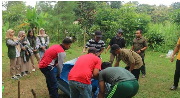
Gambar 5. Proses penutupan terpal untuk proses fermentasi

Dalam proses ini ada beberapa langkah yang perlu diperhatikan yaitu pertama bahan diaduk sampai rata, kemudian semprotkan larutan dekomposer secukupnya, aduk bahan hingga bahan bisa menyatu dengan ciri jika digenggam tidak hancur maka pertanda berhasil, tutup dengan terpal/plastik, kemudian lakukan pengadukan kembali pada hari ke 4 selama 12 hari sampai bahan campuran tidak terasa panas. Proses penutupan dengan terpal untuk memulai proses fermentasi terdapat pada Gambar 5.