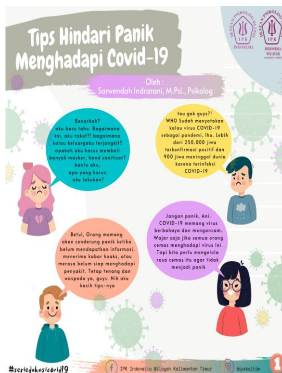
Gambar 4: Cara Menghindari Panik dalam Menghadapi COVID-19

Agar tidak mengalami distress atau panik sehingga perlu untuk melakukan berbagai hal seperti dijelaskan Gambar 4 .