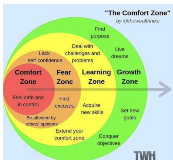
Gambar 3: Comfort Zone Theory

Setiap zona mewakili pencapaian pola pikir baru. Kebanyakan orang nyaman berada dalam comfort zone karena situasi aman dan terkendali. Tantangan yang dihadapi pada fase comfort zone , akan berlanjut pada tahap fear zone . Pada fase tersebut, kita akan merasa kurang percaya diri dan membuat alasan untuk kembali pada comfort zone (Agung, 2020). Adapun comfort zone theory dapat dijelaskan pada Gambar 3 .